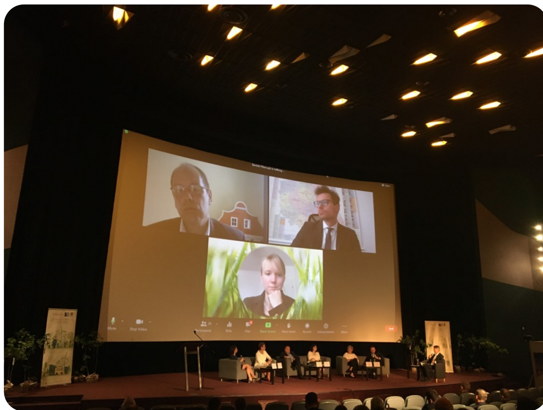
Spotkanie Kino Kijów