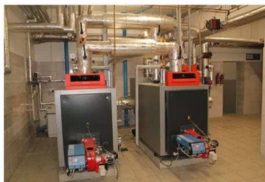
Zespół Szkół im. Dańkowskiego – Jordanów