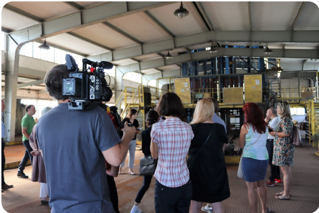
Wizyta studyjna w ramach projektu exchange EU