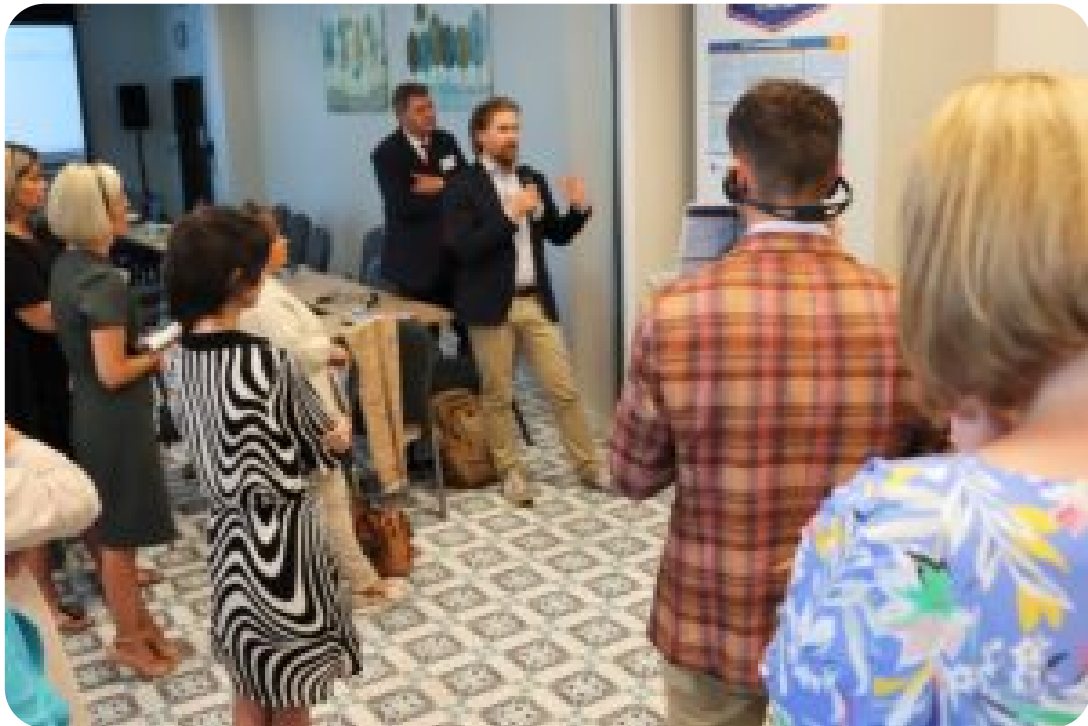
Warsztaty w ramach projektu exchange EU