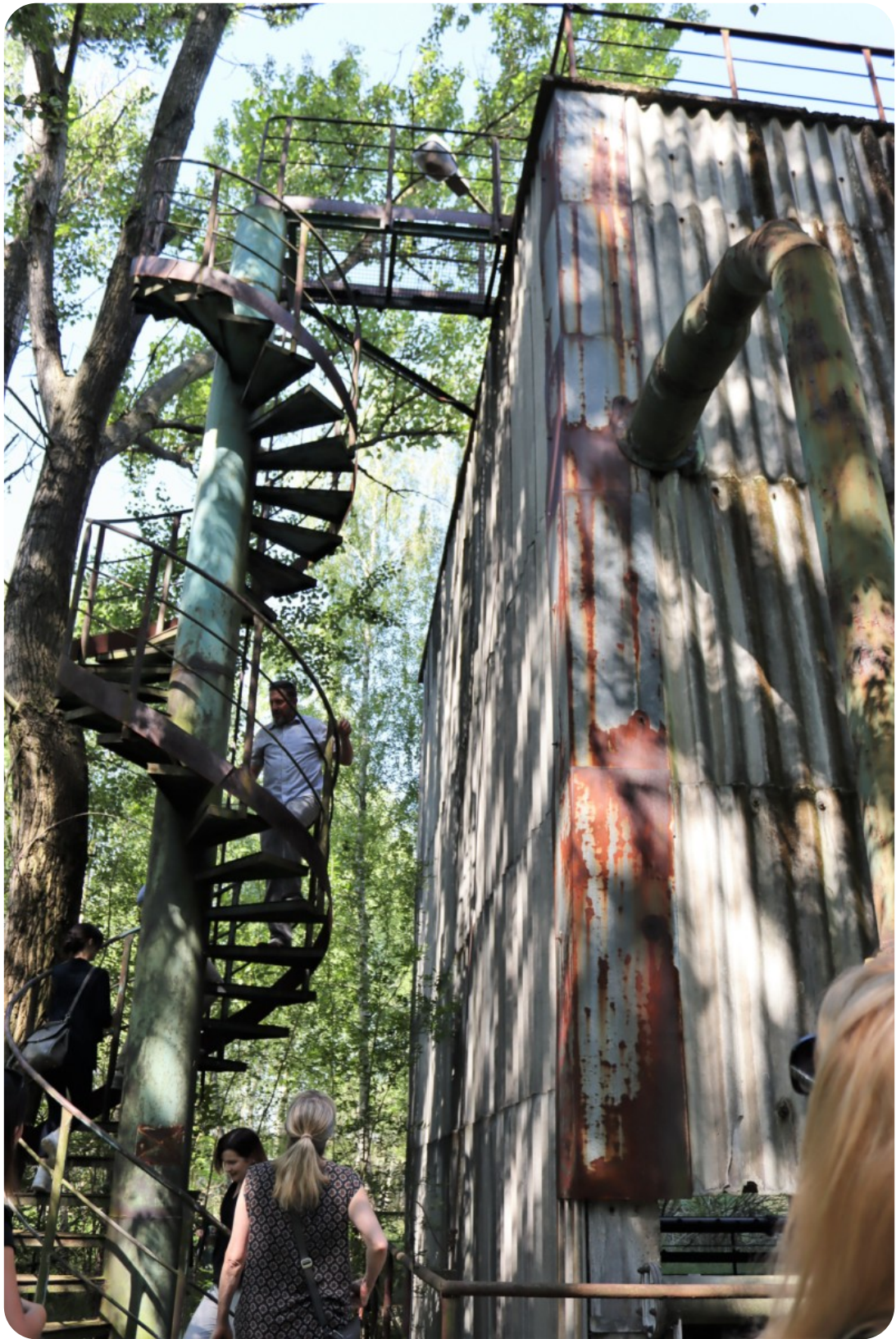
Wizyta studyjna w ramach projektu exchange EU