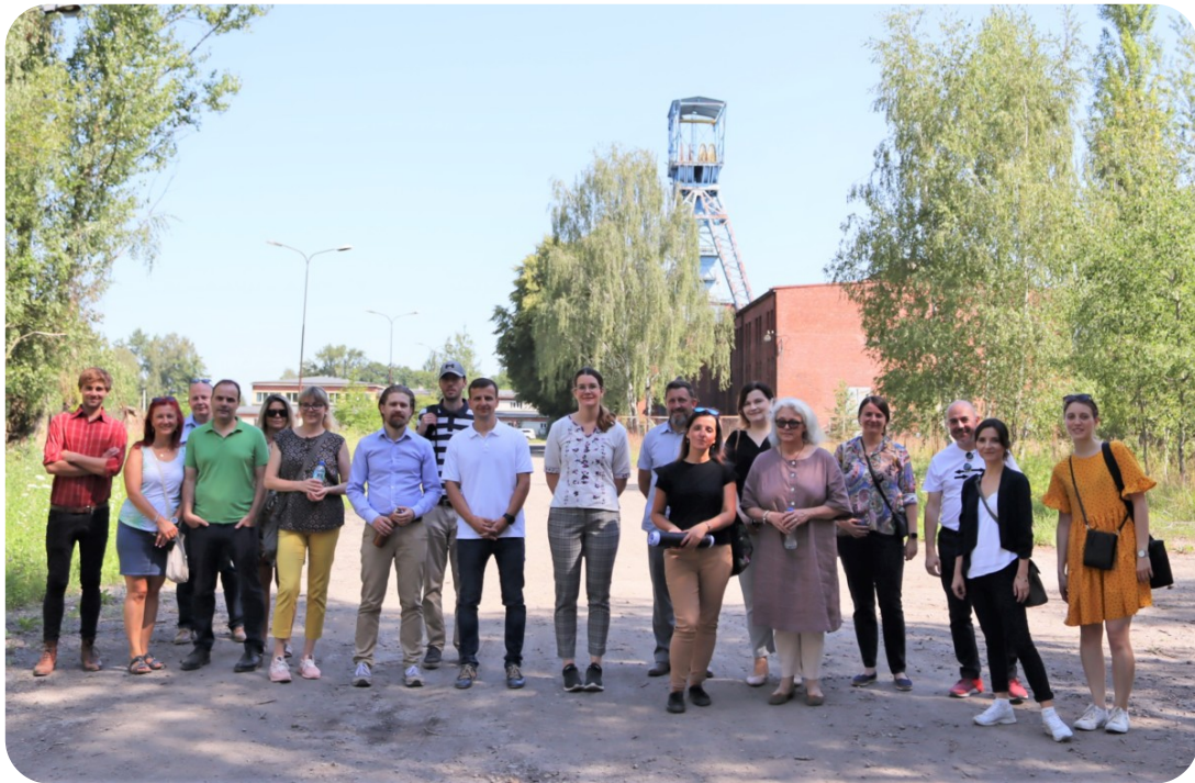
Uczestnicy wizyty studyjnej w Małopolsce