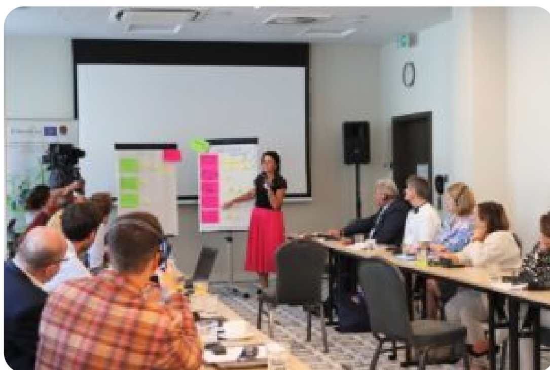
Warsztaty w ramach projektu exchange EU