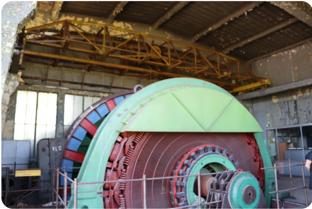
Wizyta studyjna w ramach projektu exchange EU