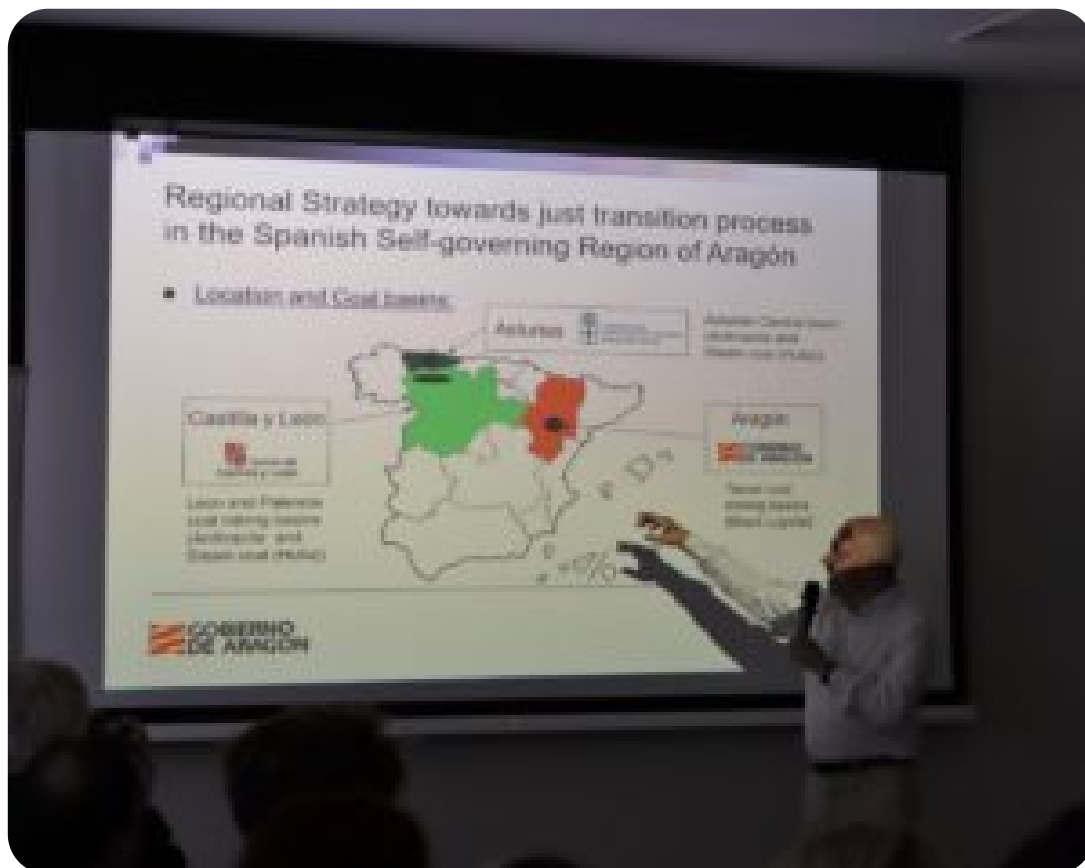
Warsztaty w ramach projektu exchange EU