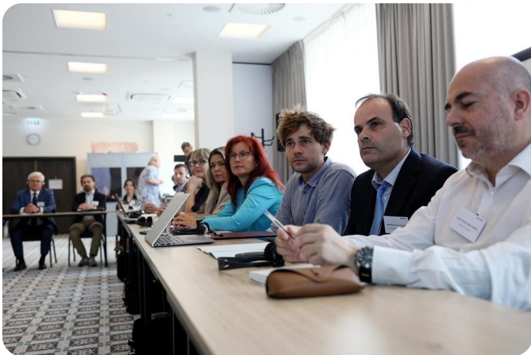
Warsztaty w ramach projektu exchange EU