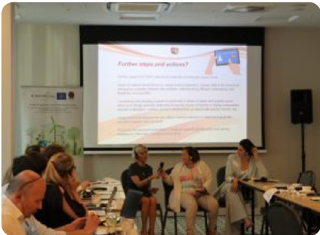
Warsztaty w ramach projektu exchange EU