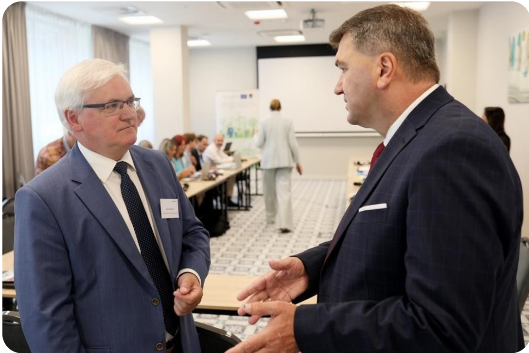
Spotkanie w ramach projektu exchange EU