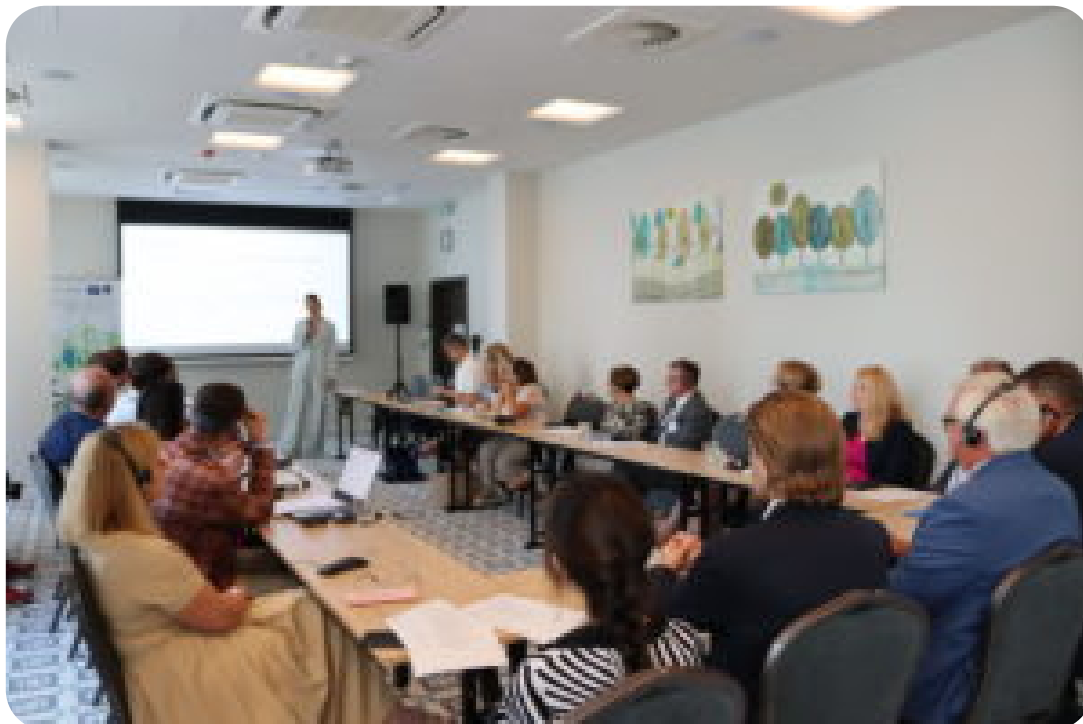
Warsztaty w ramach projektu exchange EU