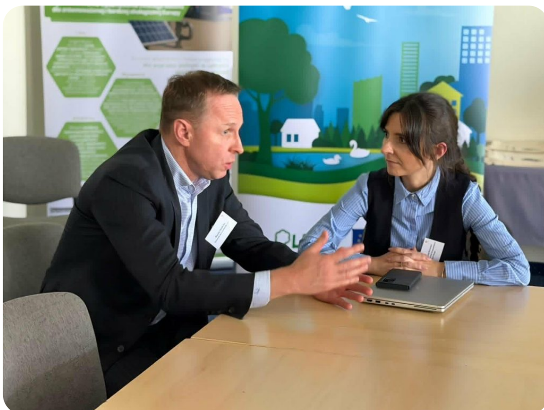
Seminarium: Transformacja energetyczna w polskich samorządach