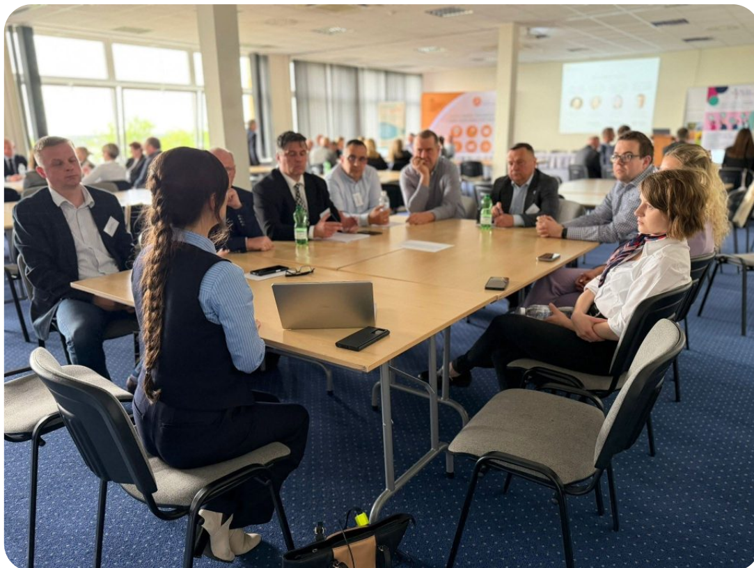
Seminarium: Transformacja energetyczna w polskich samorządach