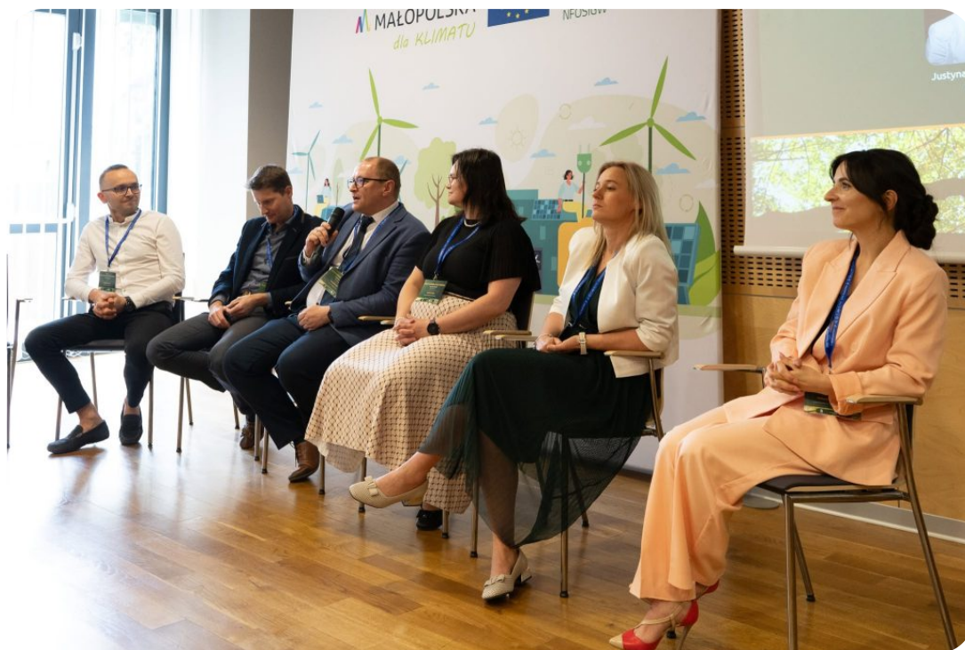
Konferencja „Niewyrzepana moc z natury”

Jednym z najważniejszych punktów konferencji była prezentacja Mapy potencjału OZE z kalkulatorem doboru instalacji - bezpłatnego narzędzia opracowanego przez ekspertów AGH w ramach projektu LIFE EKOMAŁOPOLSKA. Dzięki niemu mieszkańcy i samorządy mogą sprawdzić potencjał energetyczny swojej lokalizacji, dobrać odpowiednie rozwiązania OZE oraz oszacować koszty i opłacalność inwestycji.