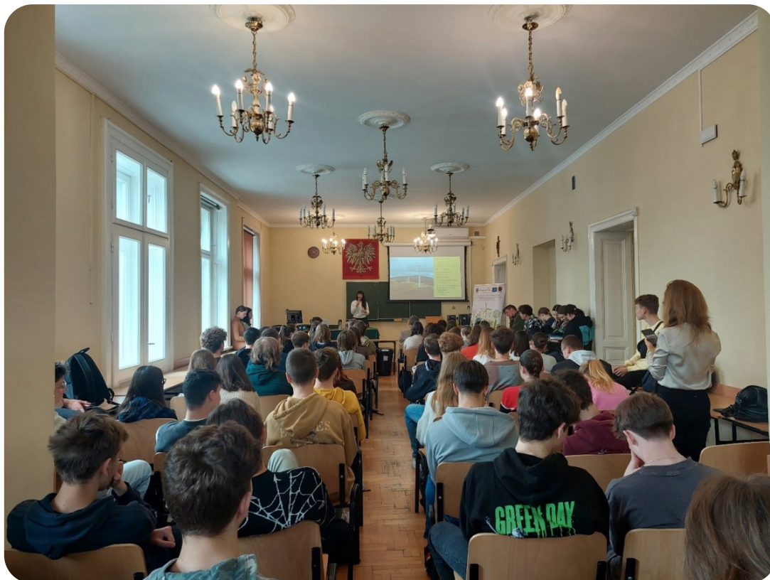
Prelekcja „Segregacja odpadów wraz z zasadą 4R” w III LO im. Adama Mickiewicza w Tarnowie