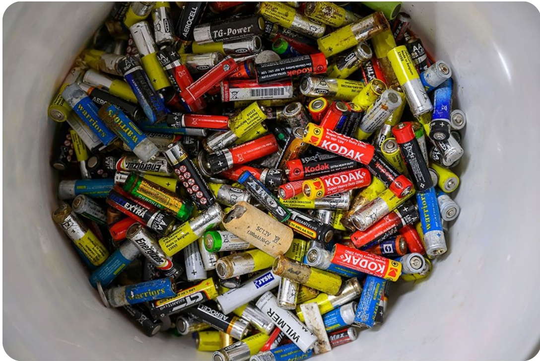
Zbiórka zużytych baterii