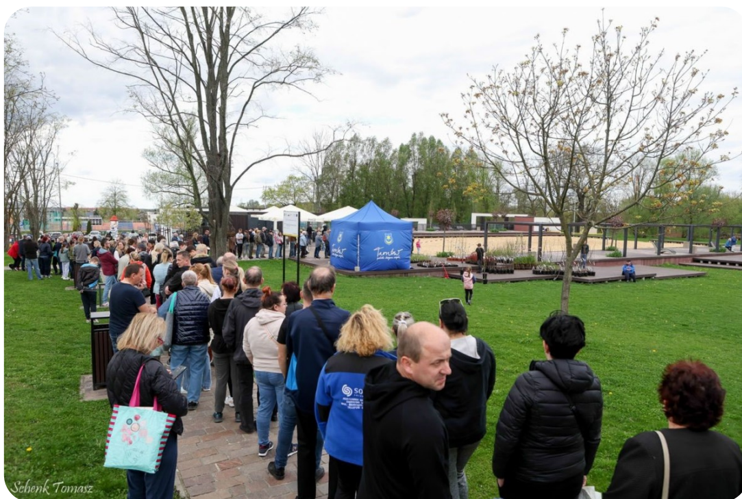
Liczne zaangażowanie mieszkańców - nie widać końca kolejki