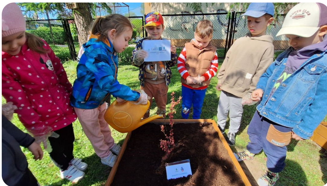
Zajęcia edukacyjne „Drzewa i ich rola w środowisku” w PP nr 14 w Tarnowie