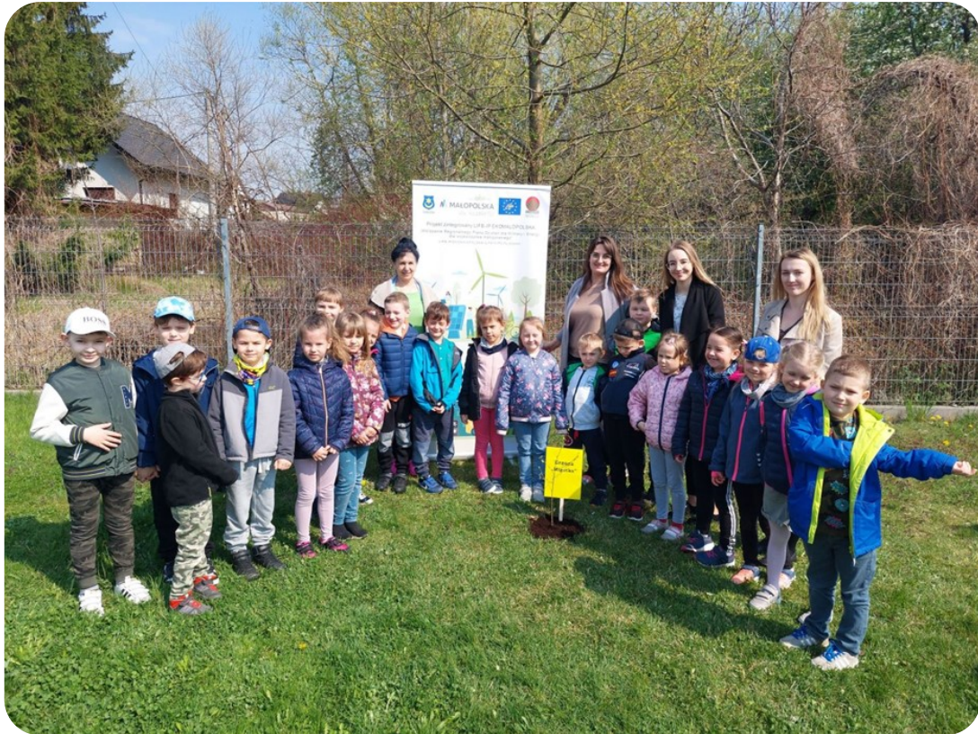
W PP nr 8 w Tarnowie posadzona brzoza dostała imię Migotka