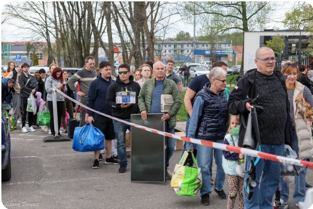
Tarnowianie podczas kampanii III Małopolski Dzień dla Klimatu przynosili elektrośmieci...