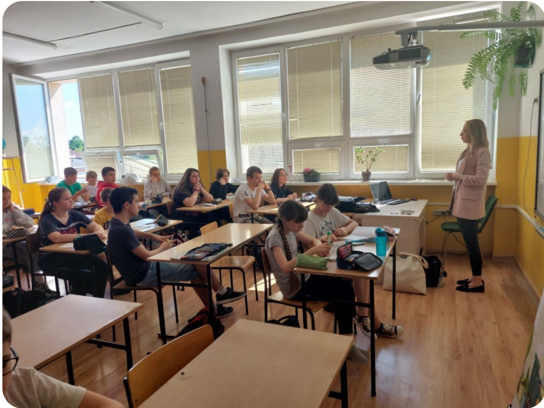
„Małopolski Zielony Tydzień” w Szkole Podstawowej nr 9 im. Orłąt Lwowskich w Tarnowie