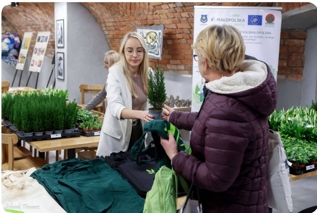
Wymiana zużytych baterii na roślinkę