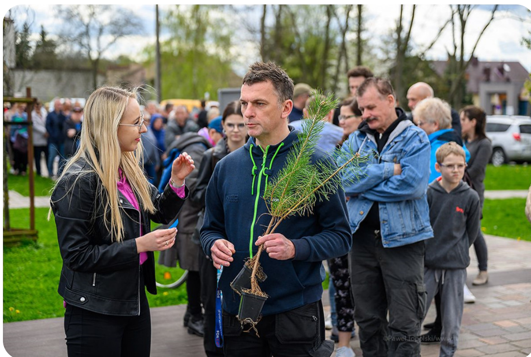
Rozmowy z mieszkańcami Tarnowa

...za które dostawali sadzonki drzew i krzewów