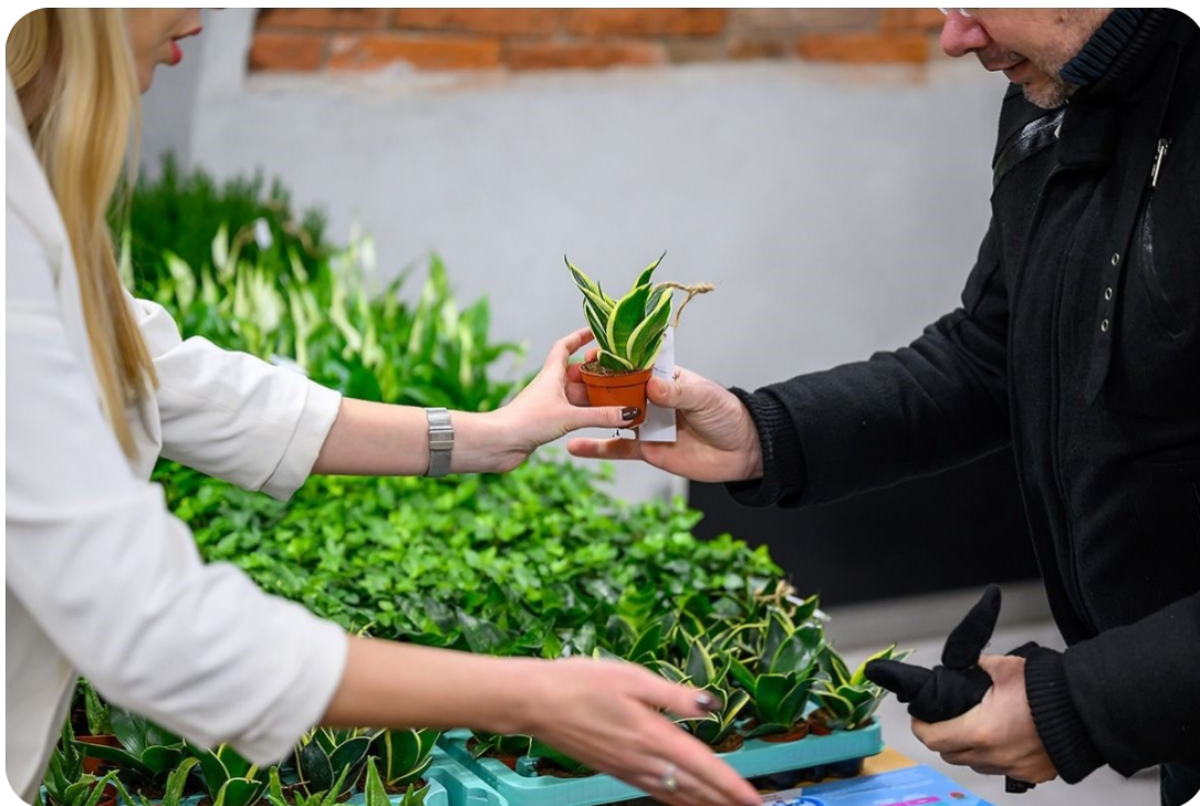
Zieleń to wielki sojusznik w dbaniu o dobry klimat