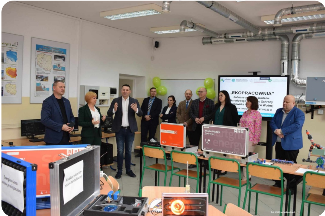
Ekopracownia OZE w Sułkowicach

Klimatyczna gra planszowa zawsze cieszy się zainteresowaniem dzieci