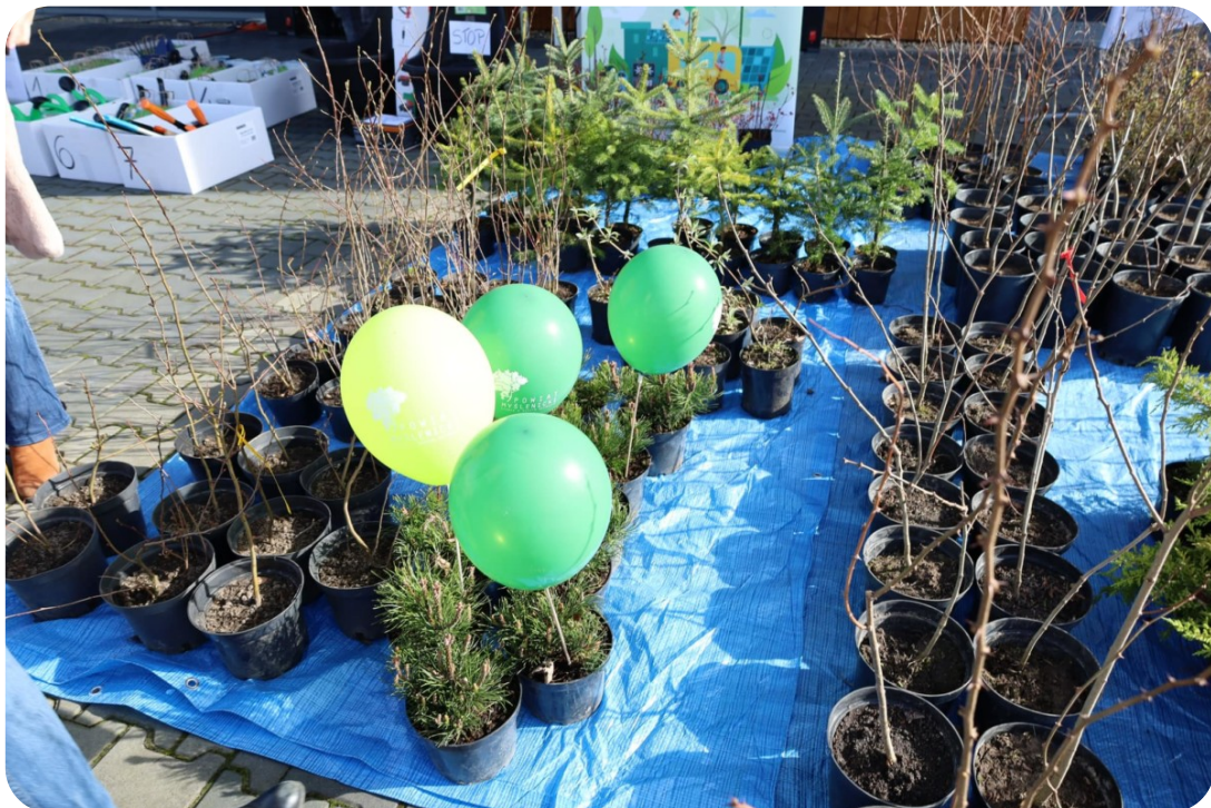
Akcja „drzewo dla klimatu”