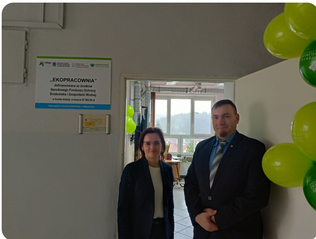
Doradcy dumni z nowej ekopracowni