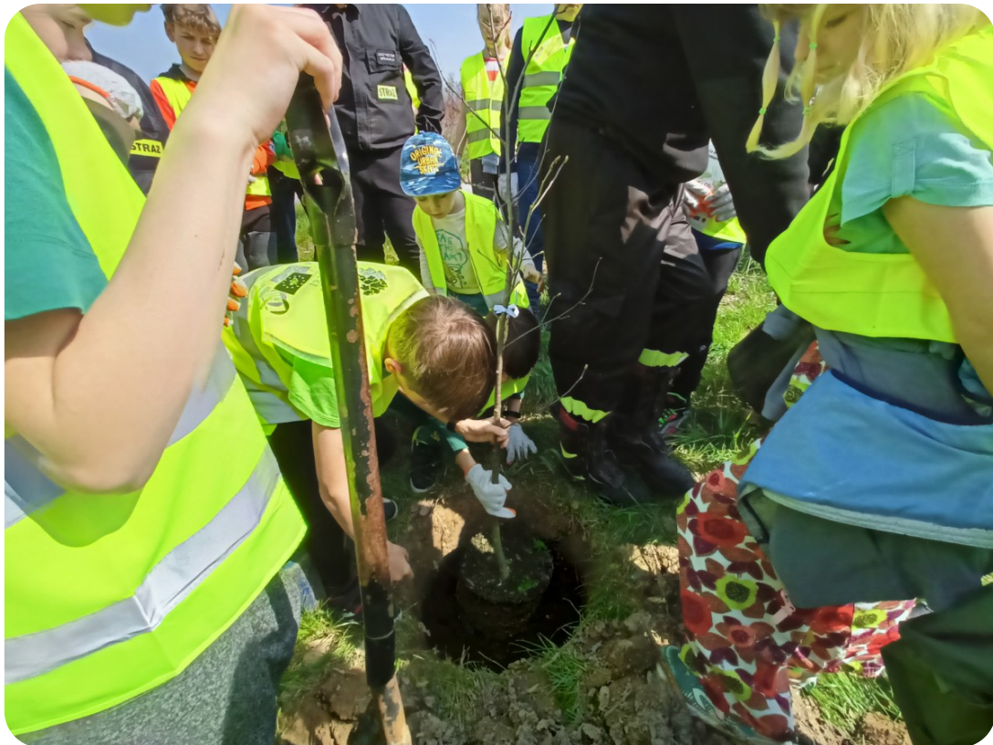
Małopolski Dzień dla Klimatu i sadzenie drzewka