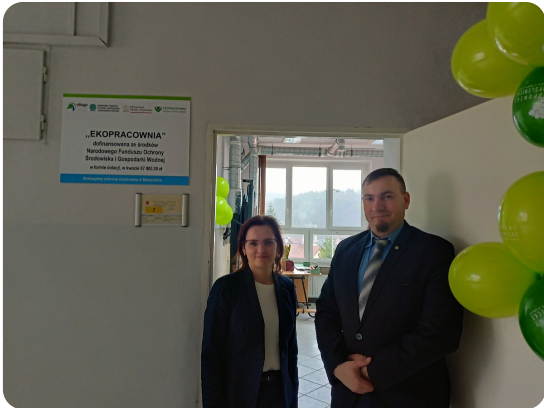
Doradcy dumni z nowej ekopracowni