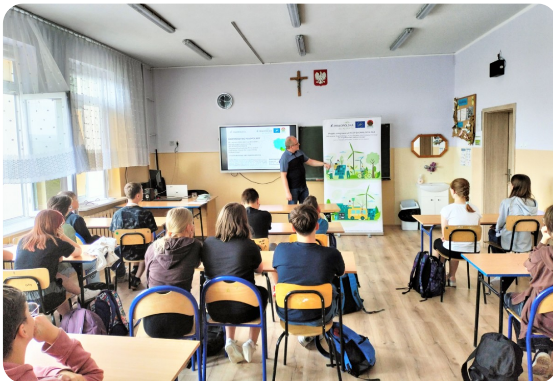
Prelekcja w szkole podstawowej w Tarnowcu