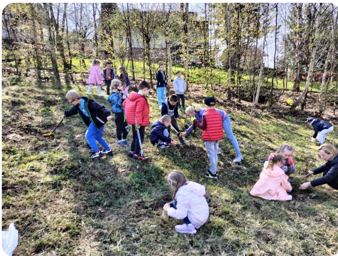
Sadzenie drzew z przedszkolakami z Łękawicy