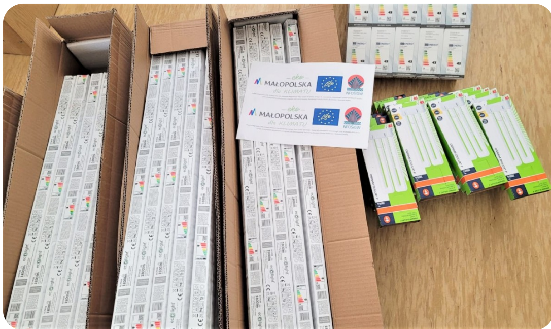
Zestaw oszczędności energii dla szkoły w Ciężkowicach