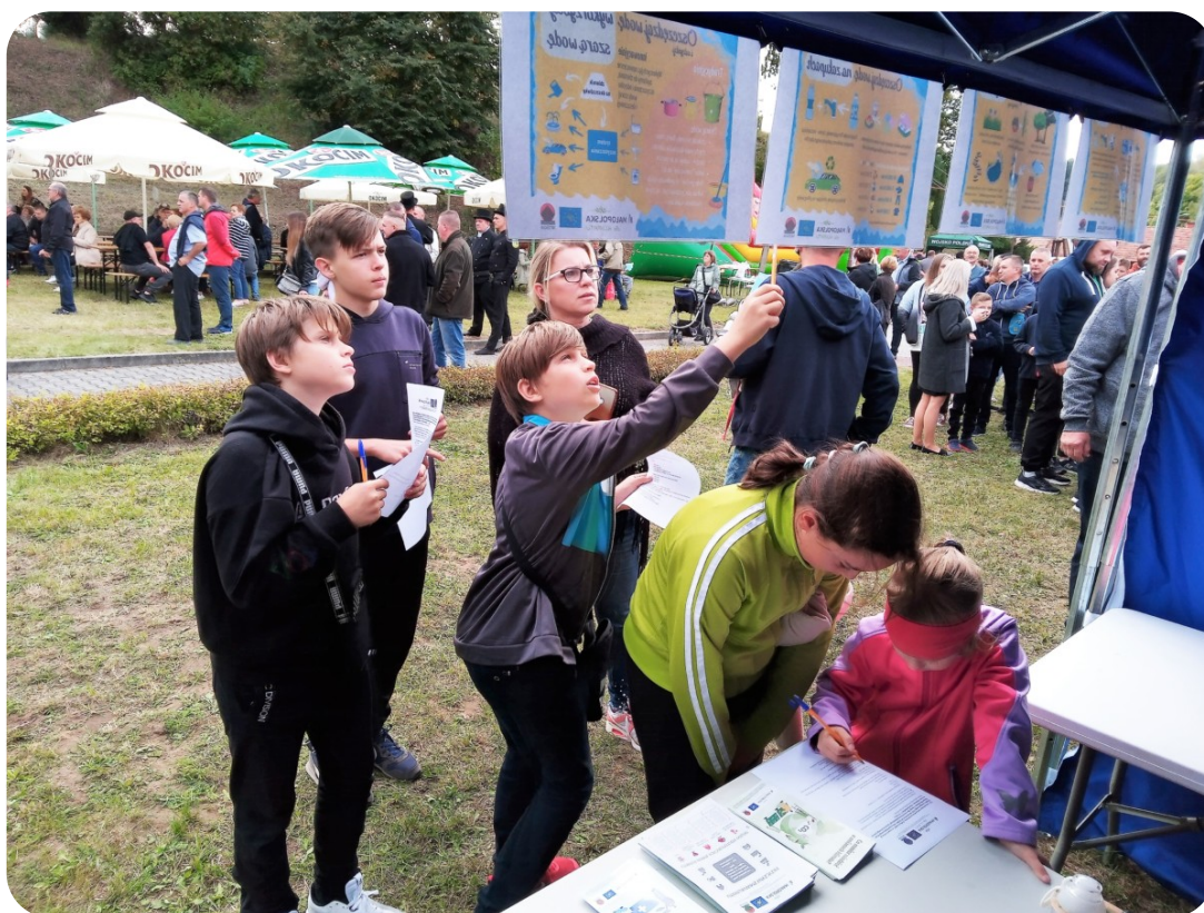
Quiz podczas wydarzenia w Porębie Radlnej