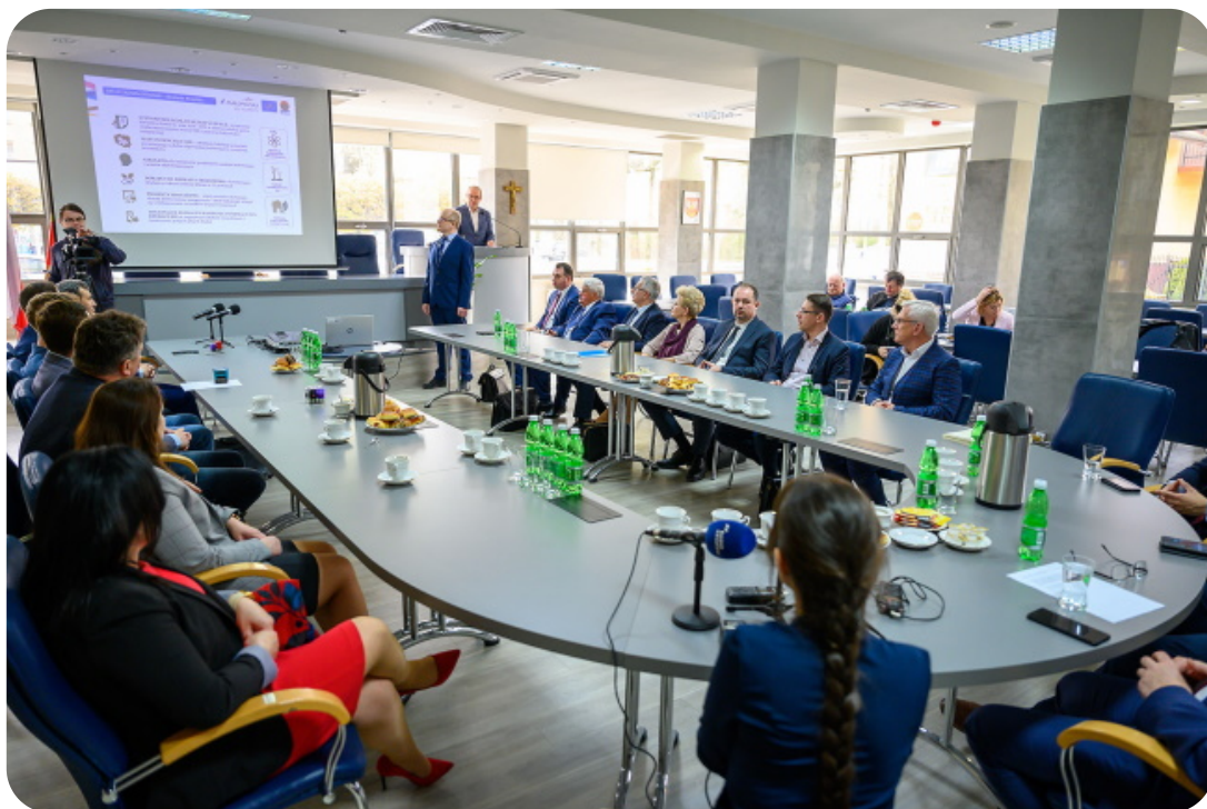
Spotkanie z burmistrzami i wójtami powiatu