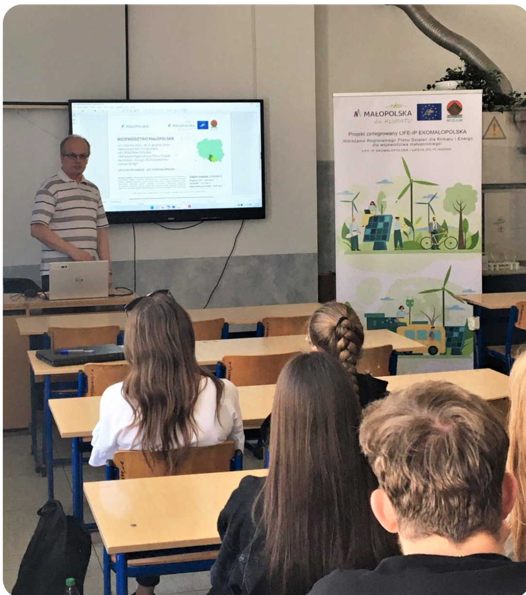
Lekcja klimatyczna w Zakliczynie

Doradca musi umieć trafić do wyobraźni każdego