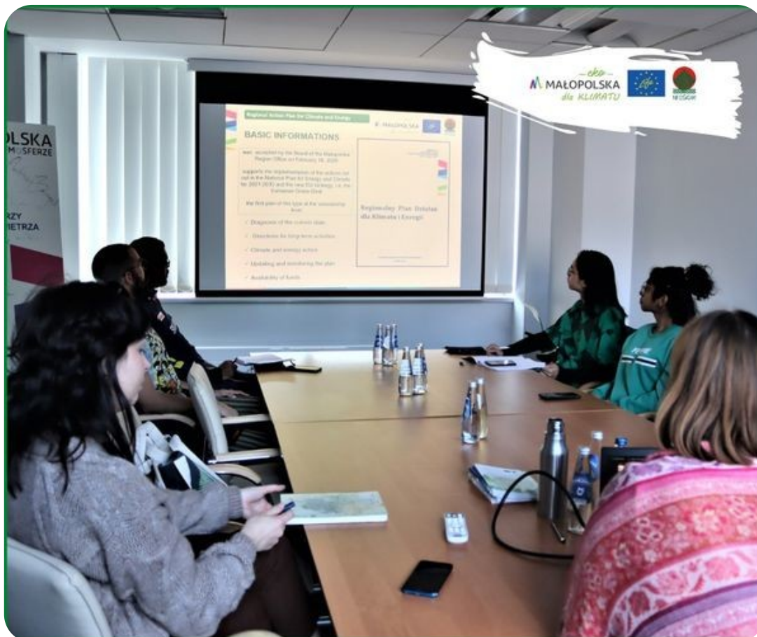
Spotkanie ze studentami UJ

Na stronie internetowej i w projektowych mediach społecznościowych ukazała się rozmowa z ekspertem w ramach cyklu „Trzy pytania o klimat” . Poruszone zostały tematy dotyczące przeciwdziałania zmianie klimatu w naszym regionie oraz plany na ich dalszą realizację.