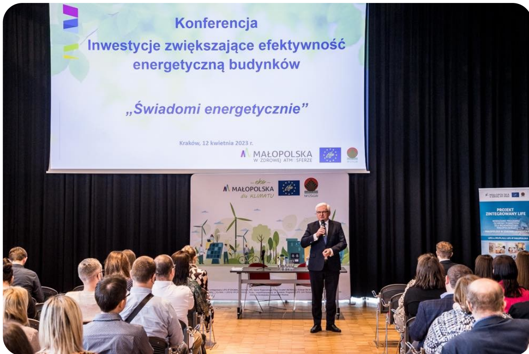
Konferencja w Muzeum Lotnictwa