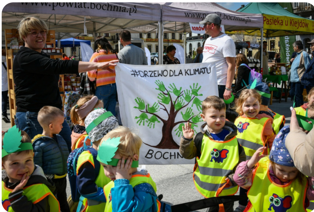
Małopolskie Dni dla Klimatu w powiecie bocheńskim