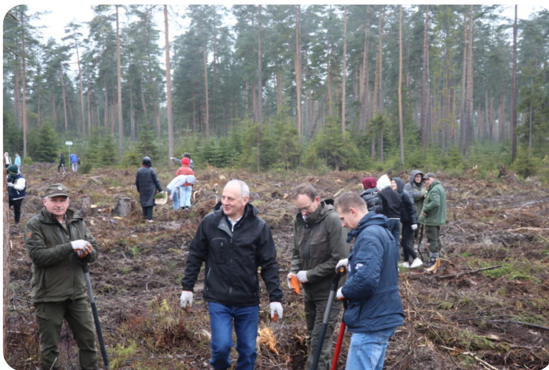
Sadzenie lasu w powiecie nowotarskim