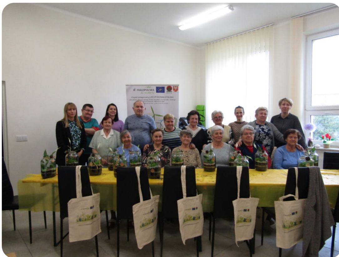
Spotkanie w powiecie wadowickim