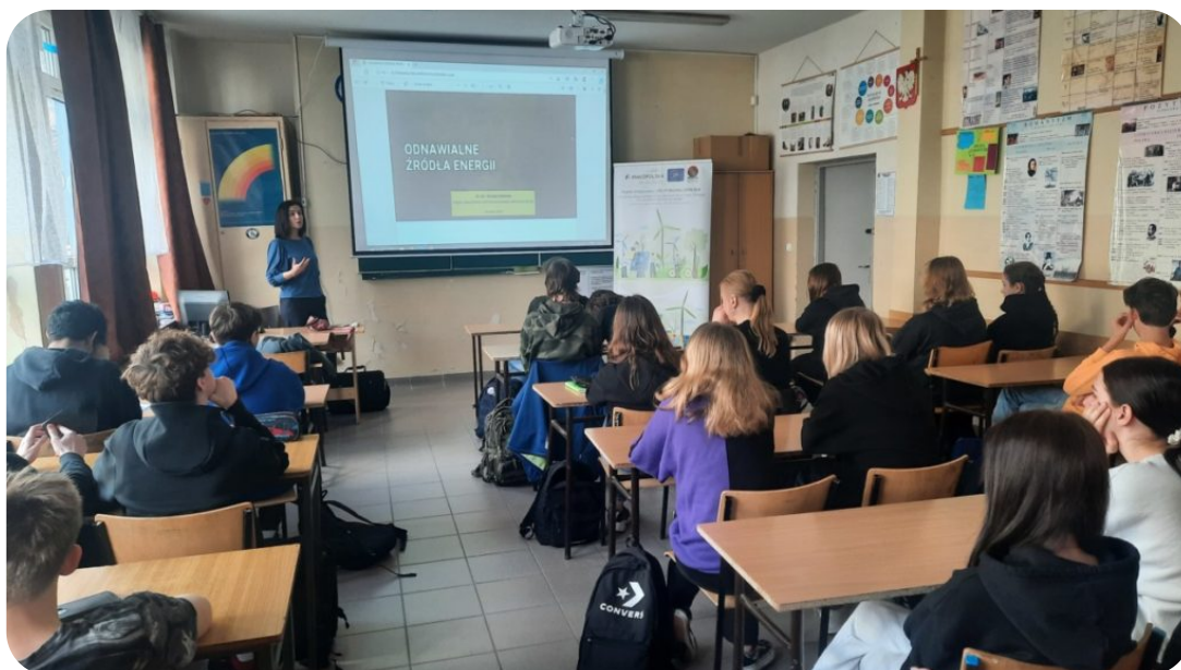
Spotkanie w szkole w powiecie krakowskim

W kwietniu doradcy dla biznesu z Małopolskiego Centrum Przedsiębiorczości: