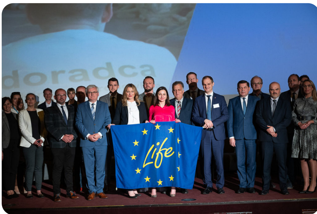
Konferencja z okazji 30-lecia Programu LIFE