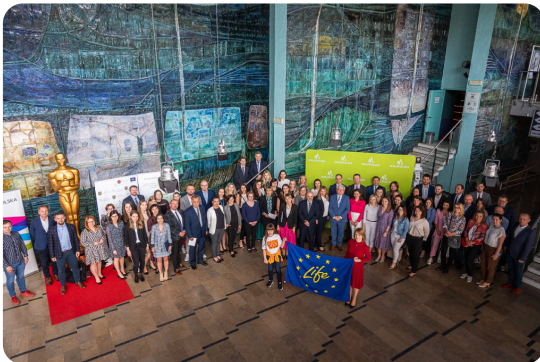
Konferencja z okazji 30-lecia Programu LIFE