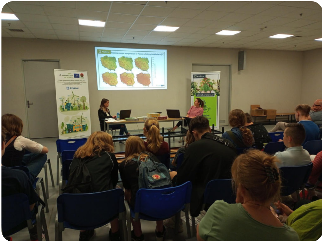
Spotkanie z mieszkańcami w Krakowie