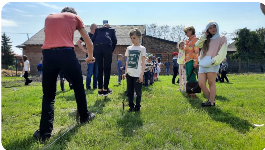
Akcja #drzewodlaklimatu w powiecie miechowskim