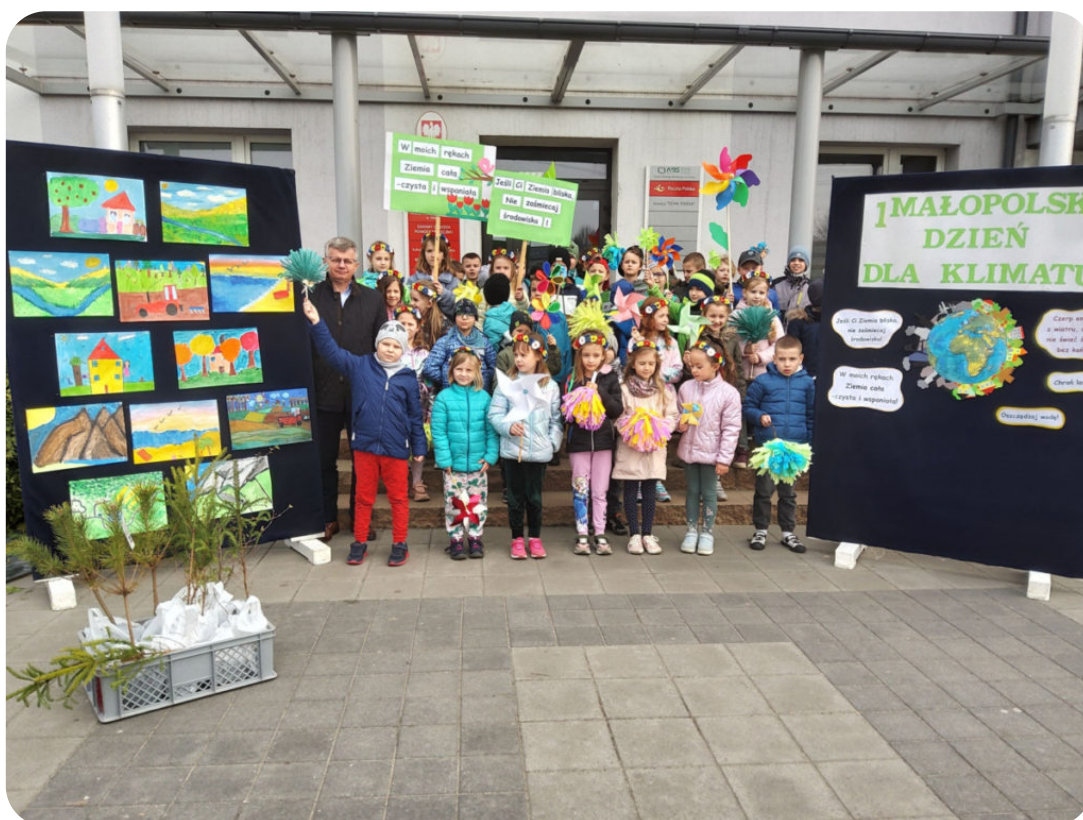
I Małopolski Dzień dla Klimatu w powiecie oświęcimskim