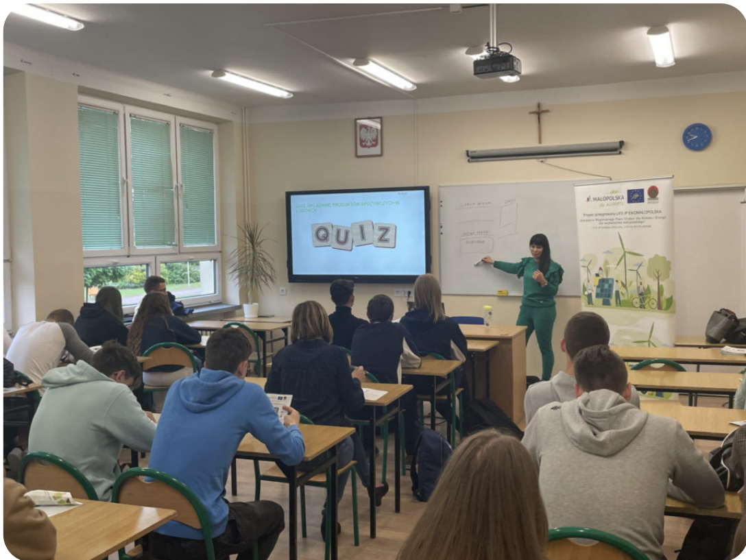
Spotkanie w szkole w powiecie dąbrowskim

W maju doradcy dla biznesu z Małopolskiego Centrum Przedsiębiorczości przeprowadzili 11 konsultacji z przedsiębiorcami w zakresie: wymiany źródła ciepła oraz możliwości pozyskania finansowania zewnętrznego, możliwości uzyskania