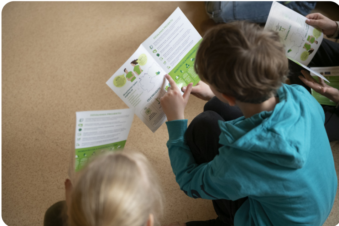
Spotkanie w powiecie proszowickim