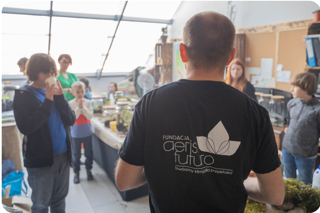
Spotkanie w powiecie wielickim