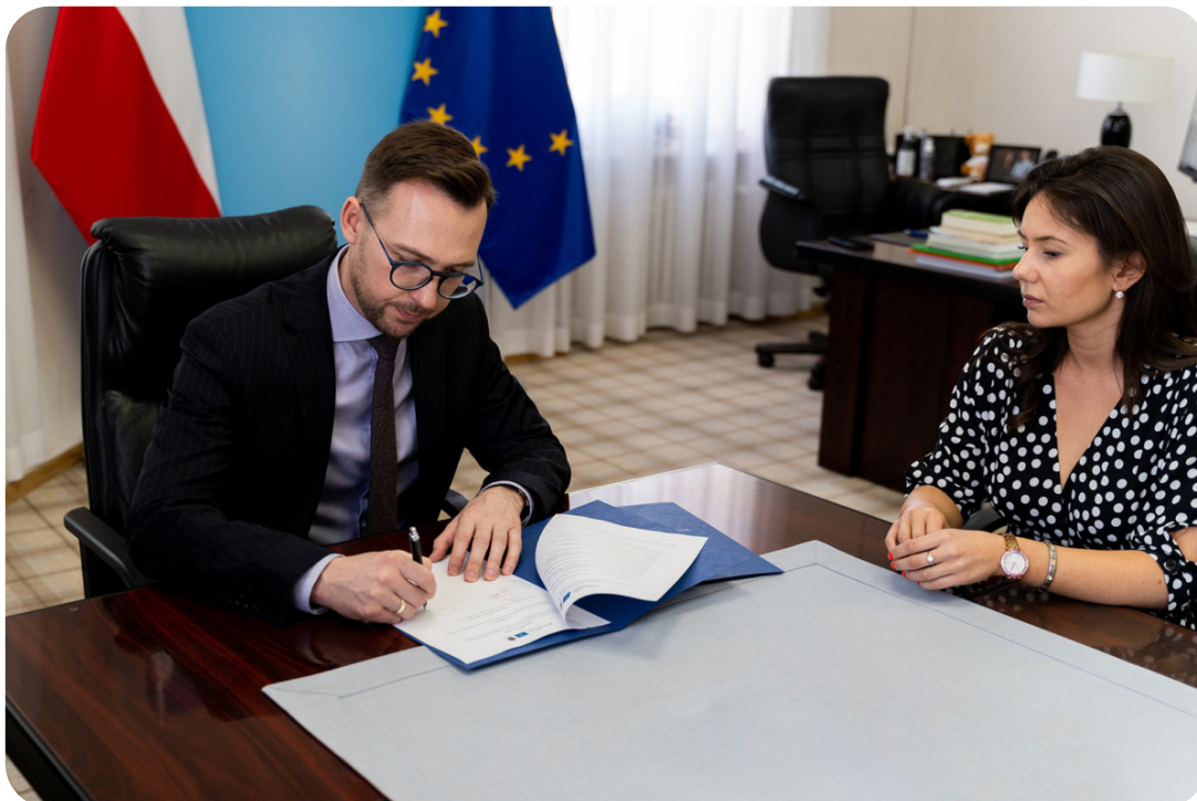
Podpisanie porozumienia w powiecie chrzanowskim

W marcu doradcy dla biznesu z Małopolskiego Centrum Przedsiębiorczości: