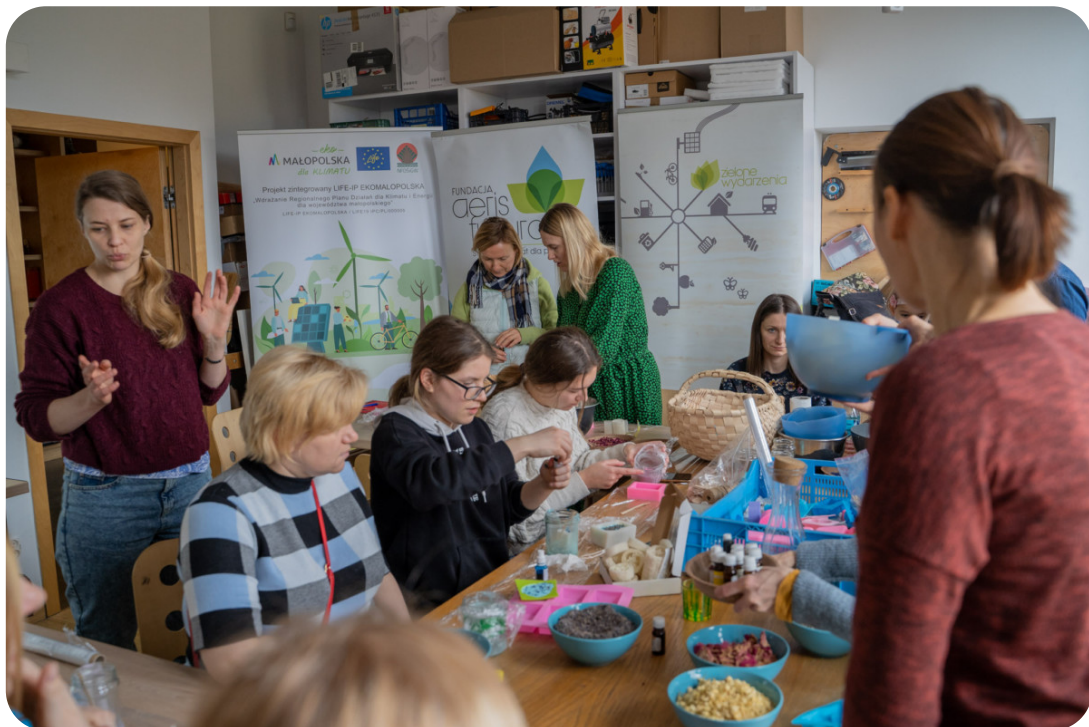
Spotkanie w powiecie wielickim