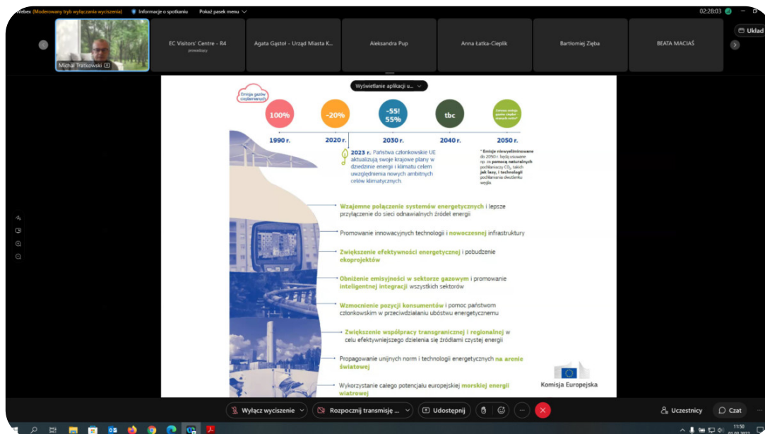
Wirtualna wizyta KE