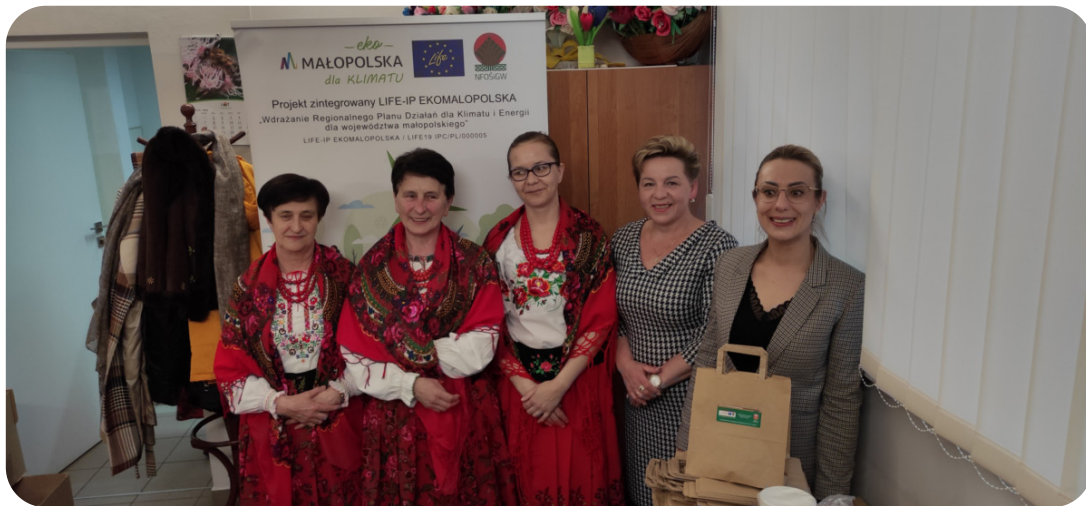
Spotkanie w powiecie limanowskim