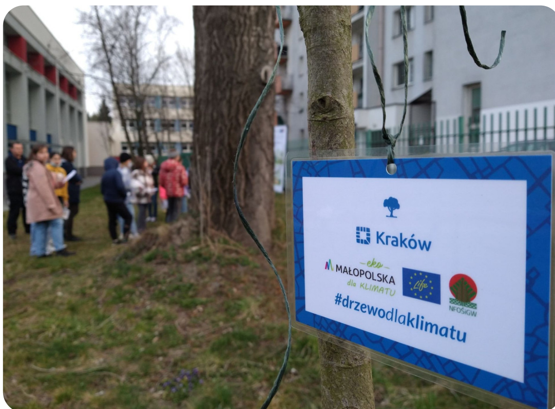
Kampania informacyjno-edukacyjna w Krakowie