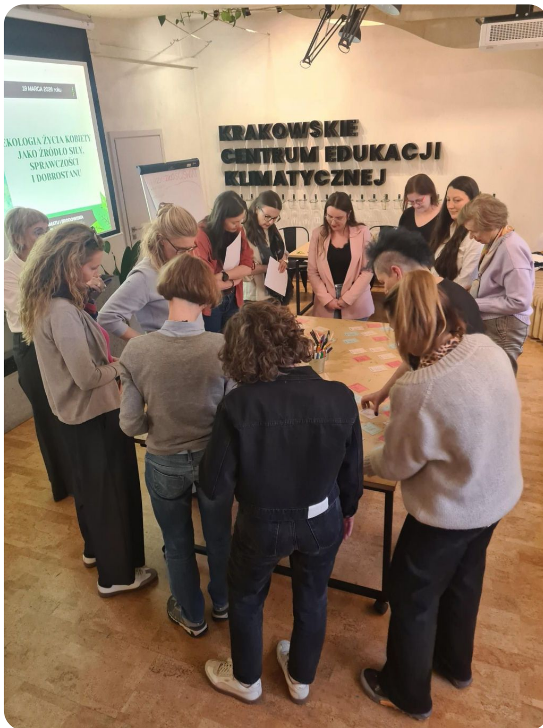
Warsztaty dla przedstawicieli jednostek miejskich UMK oraz mieszanek miasta Krakowa