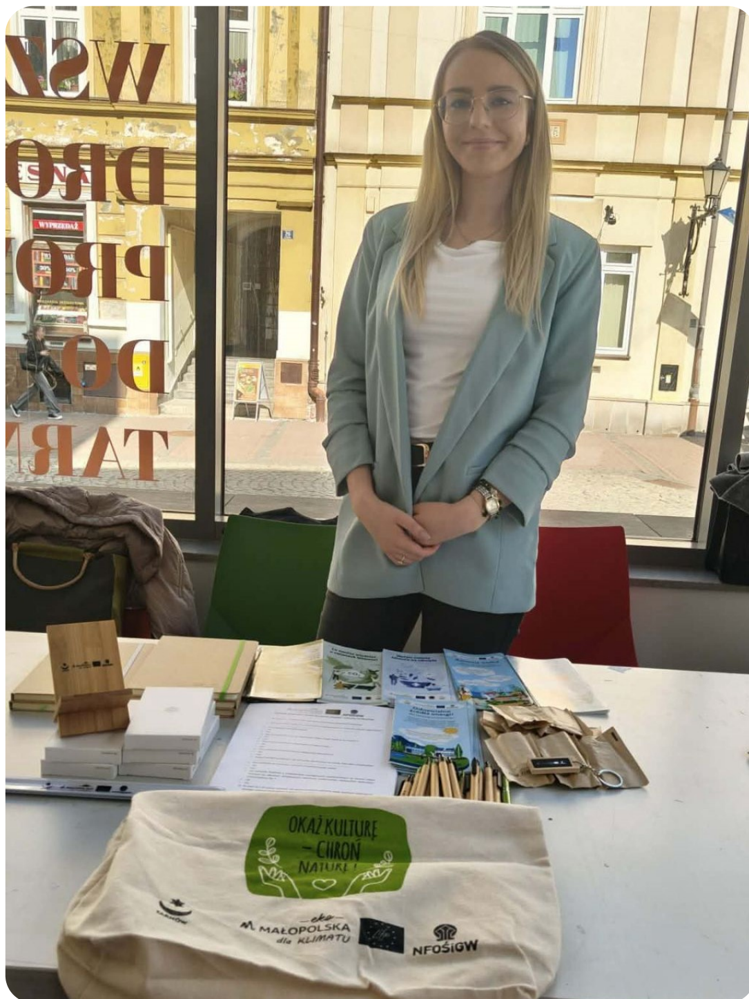
Doradczyni z Tarnowa na spotkaniu z mieszkańcami