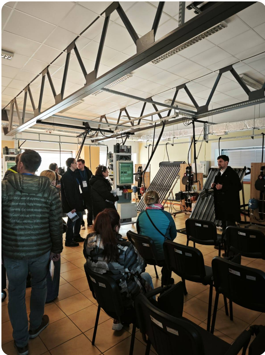
Wizyta studyjna na Śląsku