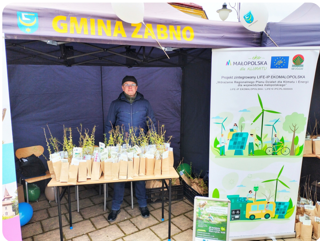
Zdjęcie z wydarzenia w powiecie tarnowskim