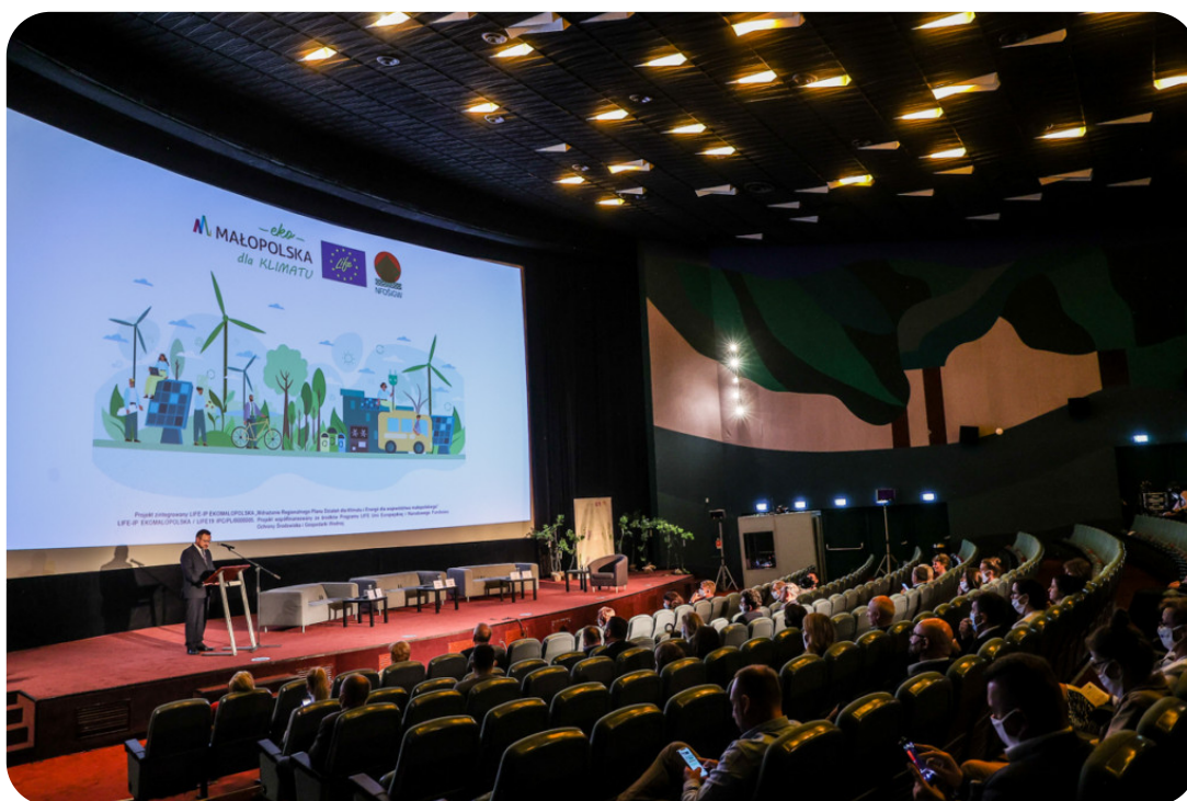
Spotkanie w Kinie Kijów