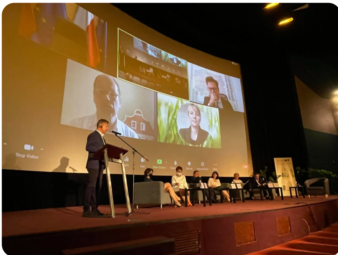
Panel dyskusyjny podczas spotkania