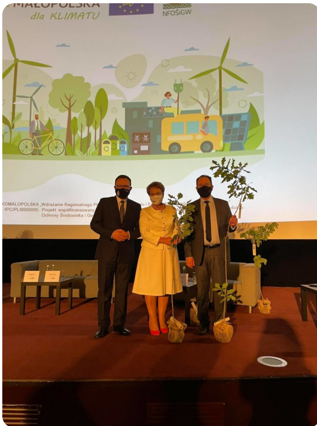
Spotkanie inauguracyjne paneliści z drzewami