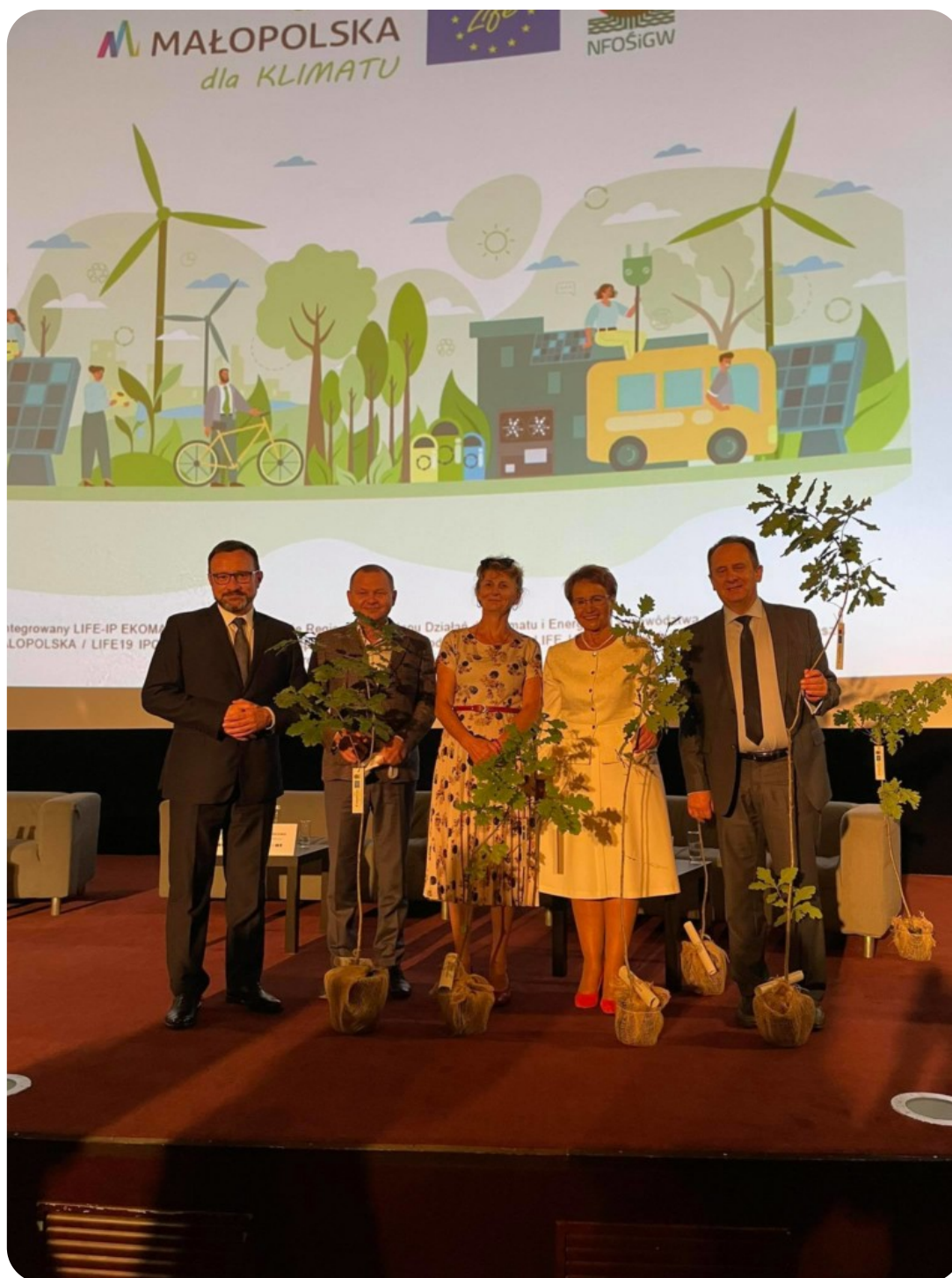
Sadzenia drzew w Małopolsce