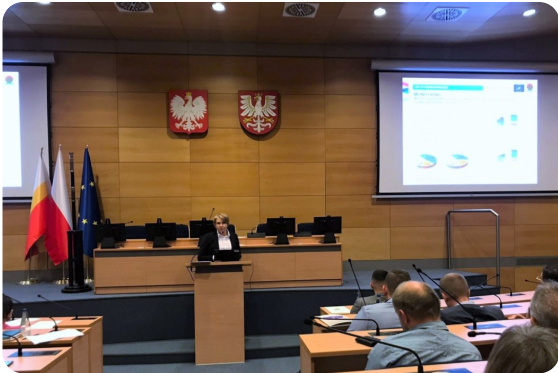
Wizyta monitorująca Projekt LIFE EKOMAŁOPOLSKA 2022