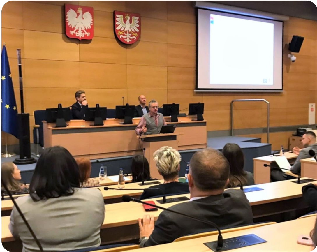
Wizyta monitorująca Projekt LIFE EKOMAŁOPOLSKA 2022