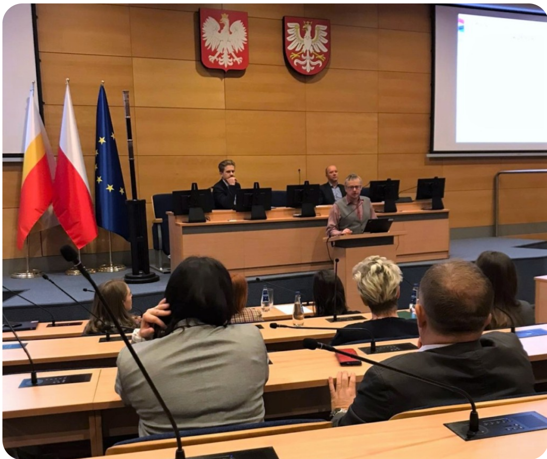
Wizyta monitorująca Projekt LIFE EKOMAŁOPOLSKA 2022