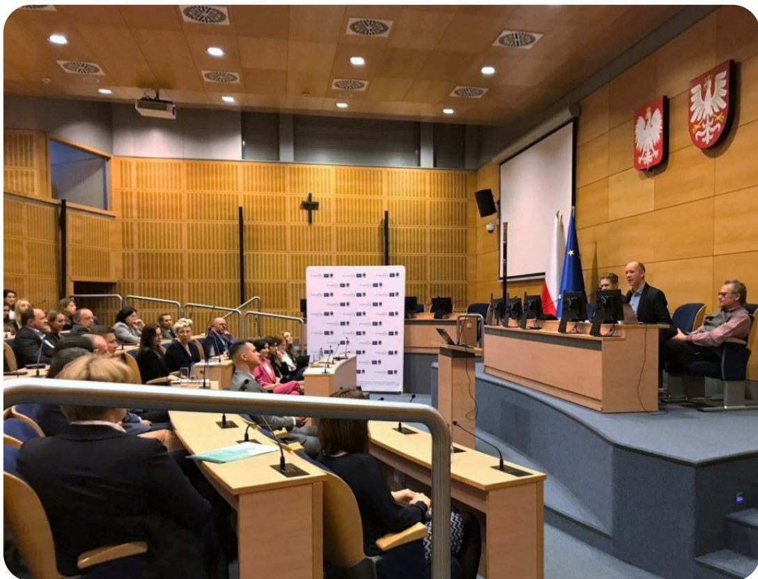
Wizyta monitorująca Projekt LIFE EKOMAŁOPOLSKA 2022