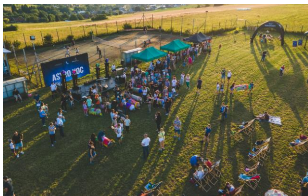
Rysunek 6 wydarzenie Astro noc

Ponadto w sierpniu w ramach Otwartego Konkursu Ofert fundacja Horyzont360 zorganizowała wydarzenie Astro noc . Wydarzenie odbyło się na stadionie Ubiad. W wydarzeniu udział wzięło około 500 osób.