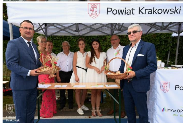
Rysunek 4 Wydarzenia organizowane w małopolskich powiatach