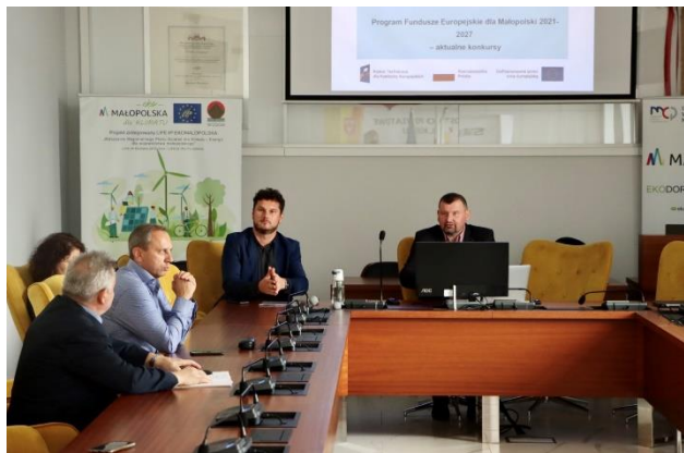
Rysunek 3 spotkanie z przedsiębiorcami powiatu olkuskiego

z zainteresowanymi przedsiębiorcami. Porady dotyczyły możliwości instalacji paneli PV, możliwości otrzymania dofinansowania na inwestycje proekologiczne, zbierania i magazynowania wody opadowej czy dotyczące Bazy Danych o Odpadach.