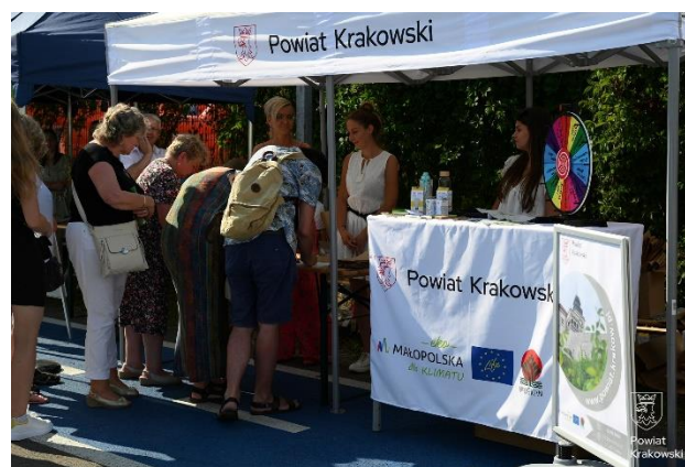
Rysunek 2 wydarzenia związane z ochroną klimatu w powiatach

Doradcy ds. biznesu z Małopolskiego Centrum Przedsiębiorczości przeprowadzili 8 konsultacji