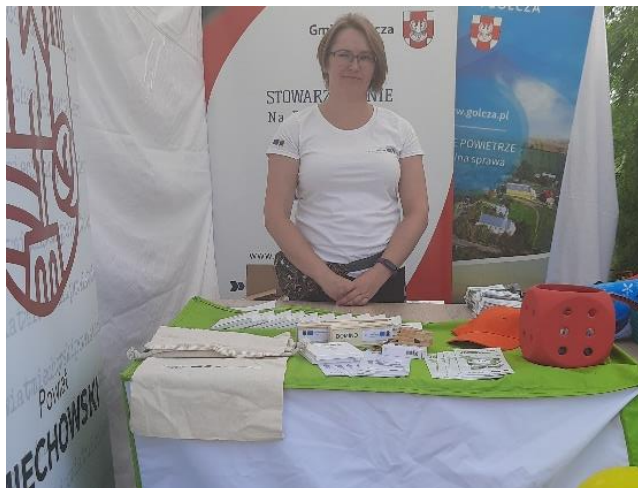
Rysunek 5 Wydarzenia organizowane przez doradców ds. klimatu i środowiska

(Miasto Kraków, Miasto Tarnów, powiaty: krakowski, nowosądecki, suski, tarnowski). Materiały o tematyce środowiskowej dotarły do ponad 3,5 tys. odbiorców .