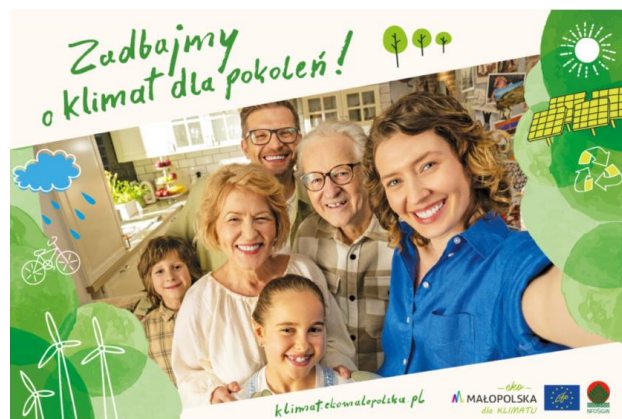
Rys. 1 Kampania "Klimat dla pokoleń"