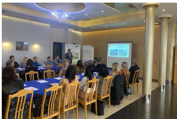
Rys. 9 Konferencja w Nowym Sączu