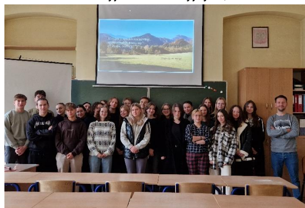
Rys. 2 Zajęcia w szkole powiatu nowotarskiego