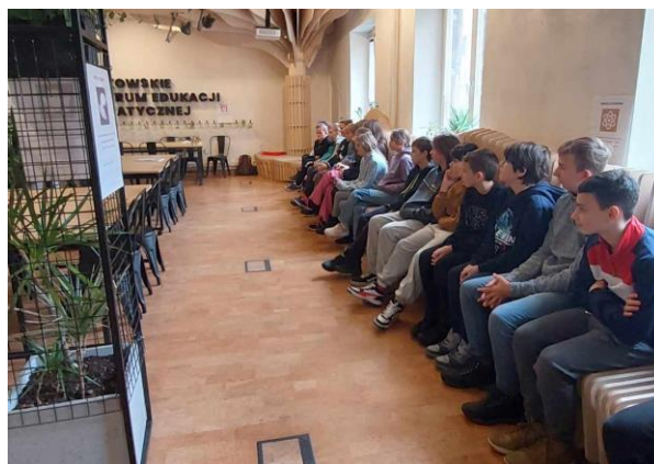
Rys. 12 Spotkanie dla uczniów w Krakowie