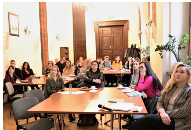
Rys. 8 Spotkanie z doradcami ds. klimatu i środowiska

W dniu 29 listopada w Polskiej Akademii Nauk odbyło się kolejne spotkanie dla doradców ds. klimatu i środowiska połączone z prelekcją dotyczącą kwestii adaptacji do zmian klimatu. Prelekcję przeprowadziło stowarzyszenie polskich gmin „Energy Cite”.