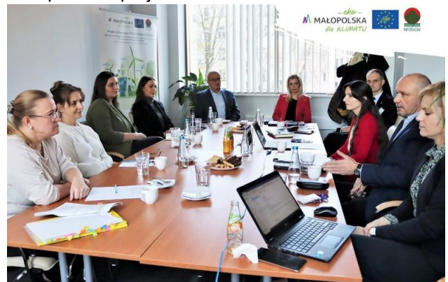
Rys. 6 spotkanie z „Podkarpackie – żyj i oddychaj”

30 listopada odbyło się spotkanie z przedstawicielami projektu Województwa Podkarpackiego „Podkarpackie – żyj i oddychaj”, który rozpocznie się w styczniu 2024 r. Celem projektu są zakrojone na szeroką skalę działania na rzecz poprawy jakości powietrza. Celem spotkania była wymiana doświadczeń i dobrych praktyk z realizacji Małopolskich projektów LIFE.