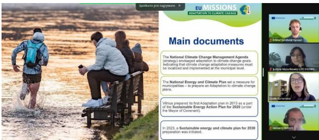
Rys. 4 Spotkania w ramach Misji EU

8 listopada odbyło się kolejne spotkanie w ramach unijnej inicjatywy Misji EU. Ponad 50 przedstawicieli europejskich regionów pracowało nad wspólnym tematem dotyczącym wsparcia dla adaptacji miast i regionów. Wsparcie techniczne na przygotowanie dobrego planu adaptacji jest możliwe dzięki pomocy technicznej MIP4Adapt. Małopolska rozpocznie projekt pomocy technicznej w kwietniu 2024 r.