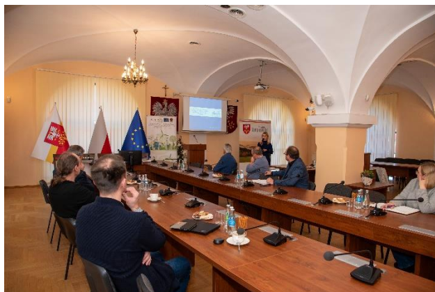
Rys. 13 Spotkanie z przedsiębiorcami powiatu limanowskiego

Doradcy dla biznesu z Małopolskiego Centrum Przedsiębiorczości: