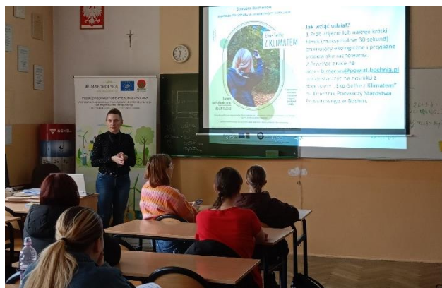
Rys. 10 Prelekcja w szkole w powiecie bocheńskim