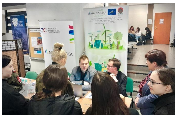
Rys. 11 Powiatowy dzień przedsiębiorczości w Olkusz