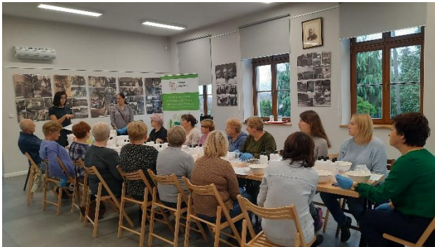
Rys. 3 Warsztaty w powiecie krakowskim