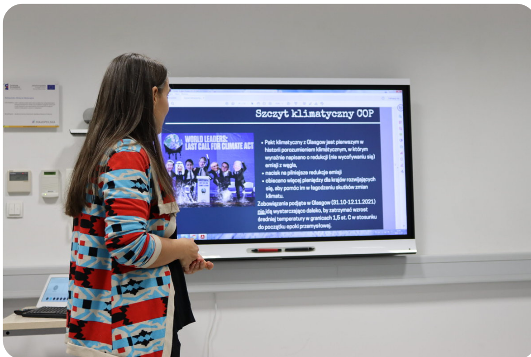
Zajęcia w ramach Małopolskiej Chmury Edukacyjnej